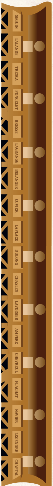
face au Trocadéro

APPRENEZ-EN PLUS SUR LA DEMOISELLE DE FER, AVANT DE VOUS LANCER DANS L'ASCENSION !