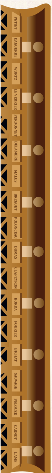
face à l'avenue de La Bourdonnais